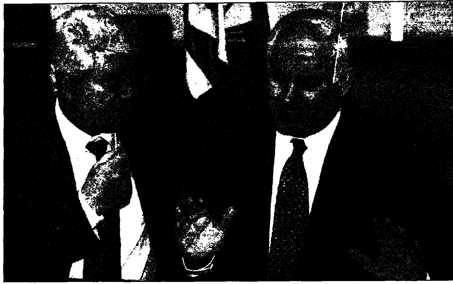
رئيس الوزراء الإسرائيلي ييتزحار رابين يناقش خطة الانسحاب من الضفة مع وزير خارجيته يهودا بار (يمين)

القدس - من برنامي بيروتون من داني غورابيه، تخفق مجلس الوزراء الإسرائيلي في التوصل إلى قرار منسحب من الضفة الغربية، وذلك بعد مناقشة الخطة الثلاثية من قبل الوزراء الإسرائيليون في جلسة استثنائية في القدس، وذلك بعد مناقشة الخطة الثلاثية من قبل الوزراء الإسرائيليون في جلسة استثنائية في القدس، وذلك بعد مناقشة الخطة الثلاثية من قبل الوزراء الإسرائيليون في جلسة استثنائية في القدس.